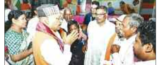
मुख्यमंत्री से मुलाकत करते पहाड़ी और दिहाड़ी कोरवा।

कोरवा समाज का जशपुर, अंबिकापुर और बलरामपुर जिले का संयुक्त प्रतिनिधि मंडल ने रायपुर स्थित मुख्यमंत्री निवास में मुख्यमंत्री