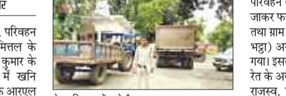
रेत परिवहन में लगे ट्रैक्टर जब्त।